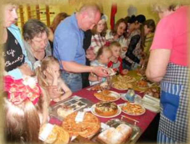
На фото: «Ярмарка»