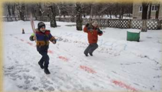
На фото: Спортивно-патриотическая игра «Зарница»