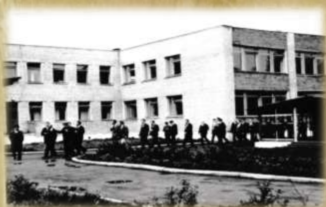
На фото: делегация из Чехословакии.

В конце 70-х г.г. незабываемым событием для детского сада была встреча делегации железнодорожников из дружественной Чехословакии, города Мартин.