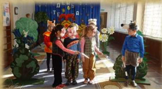
На фото: День театра