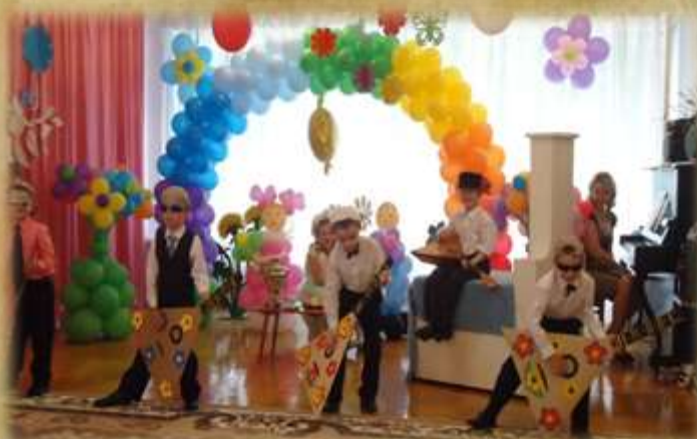
На фото: Выпускные