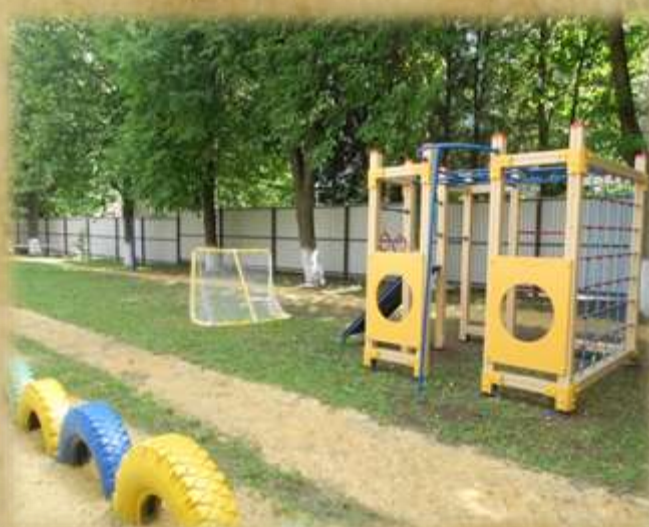
На фото: спортивная площадка