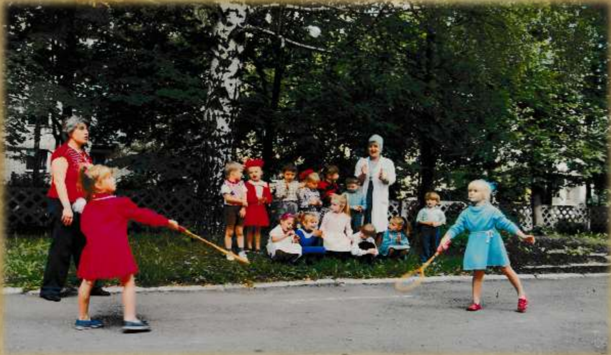
На фото: физкультурно-оздоровительная работа (1988 г.)