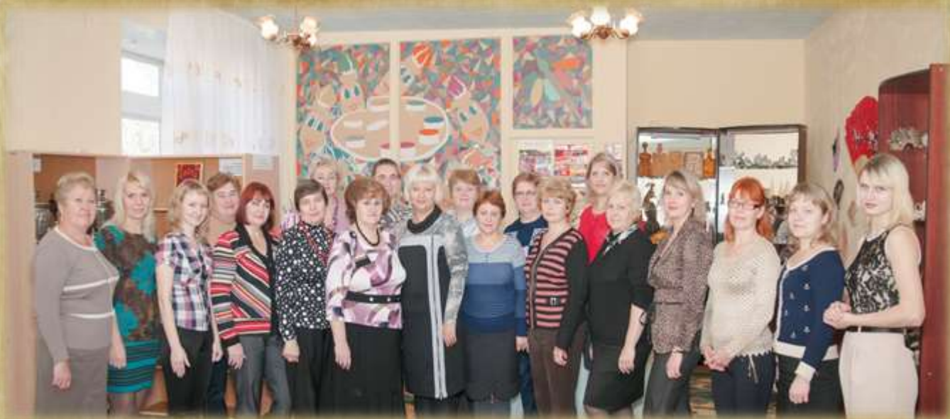
На фото: педагогический коллектив (2014г.)

Дружно и слаженно продолжал работать творческий коллектив педагогов, энтузиастов своего дела. Коллектив постарался, чтобы детям было уютно и комфортно в своих группах и прогулочных участках, чтобы здесь они видели яркость, многоцветие, красоту.