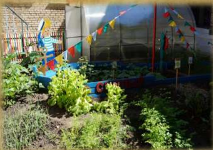
На фото: теплица и огород