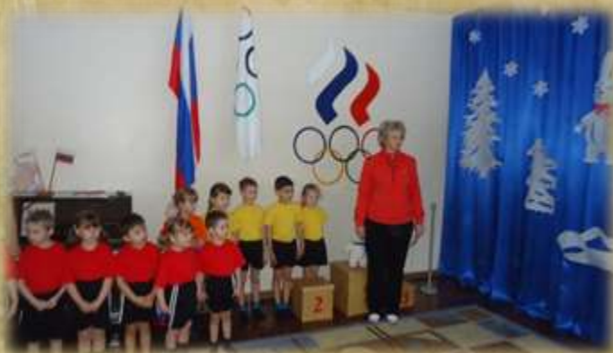
На фото: физкультурно-спортивный праздник