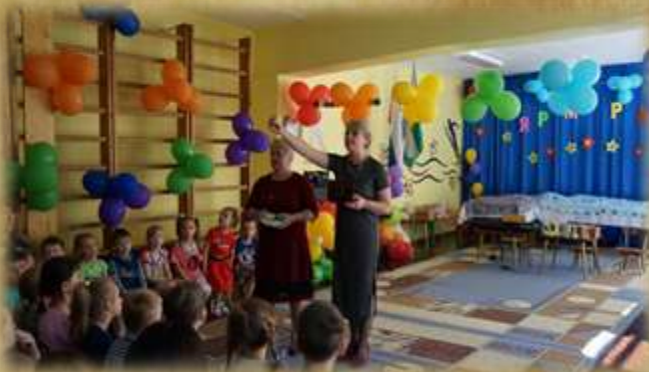
На фото: «Ярмарка»

1 сентября – День Знаний; октябрь – Праздник Осени; ноябрь – День Матери; 14 декабря – День освобождения Узловой от немецко-фашистских захватчиков; декабрь – Новогодние праздники; январь – Рождество, прощание с ёлкой февраль – День защитника отечества февраль – Масленица; март – День 8 Марта, День театра; 1 апреля – День Юмора; апрель – День Космонавтики; 7 апреля – Всемирный день здоровья; май – День Победы, Спортивно-патриотическая игра «Зарница»; май – Выпускные утренники; 1 июня – День защиты детей, Ярмарка; июнь – День России, физкультурно-спортивный праздник «Здравствуй, лето»; 8 июля – День семьи, любви и верности; Август – День флага.