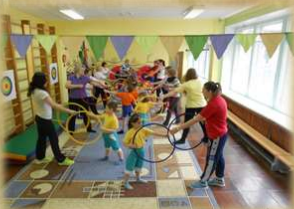
На фото: День здоровья