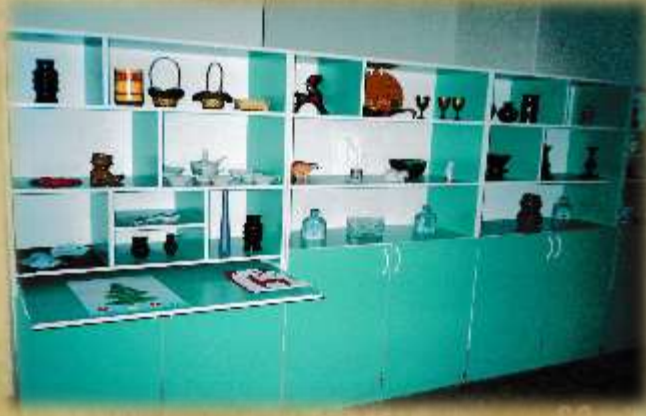
На фото: изостудия (2005г.)

Оборудованы кабинеты для специалистов: учителей-логопедов, педагога-психолога, музыкальных руководителей, инструктора по физической культуре.