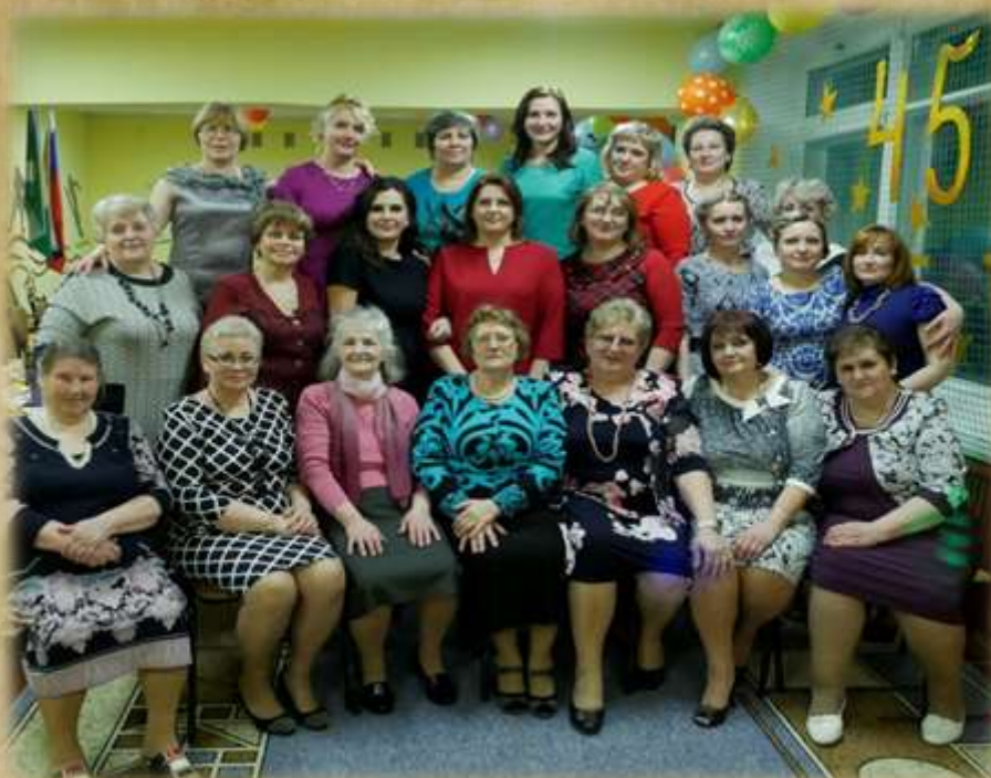
На фото: сотрудники и ветераны труда на юбилейном вечере.

1 марта 2017 года наш детский сад перешагнул 45-летний рубеж своего существования. Коллектив старается не забывать ветеранов труда детского сада и приглашает их на свои праздники.