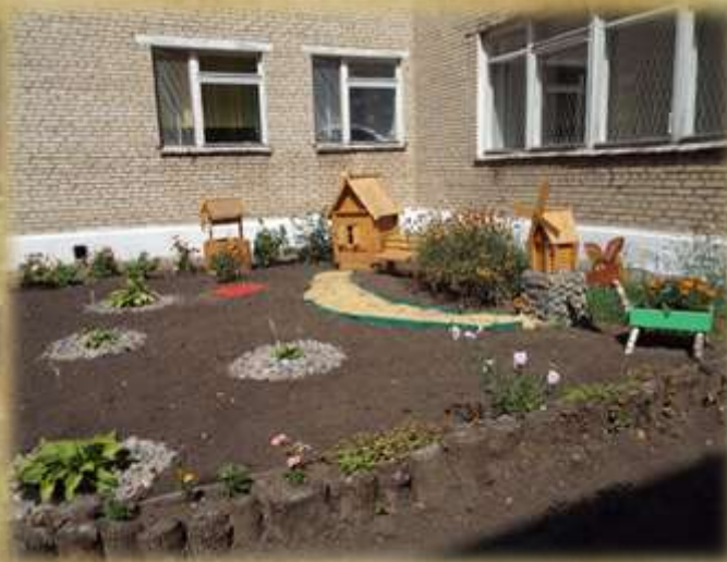
На фото: «Деревенский дворик» (2014г.)