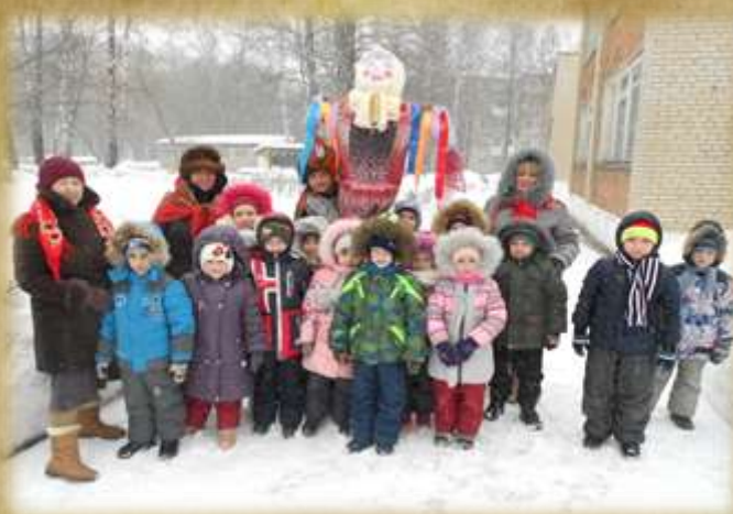
На фото: Масленица