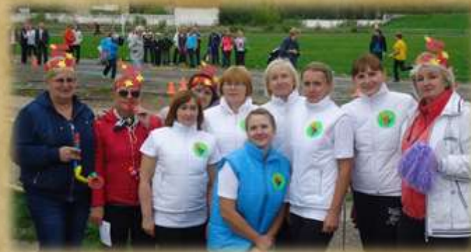
На фото: педагогическая спортландия