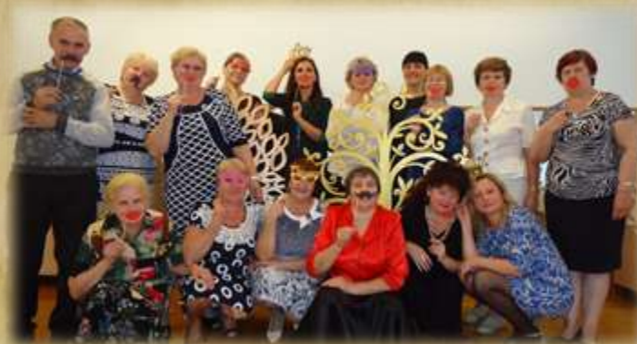
На фото: день дошкольного работника