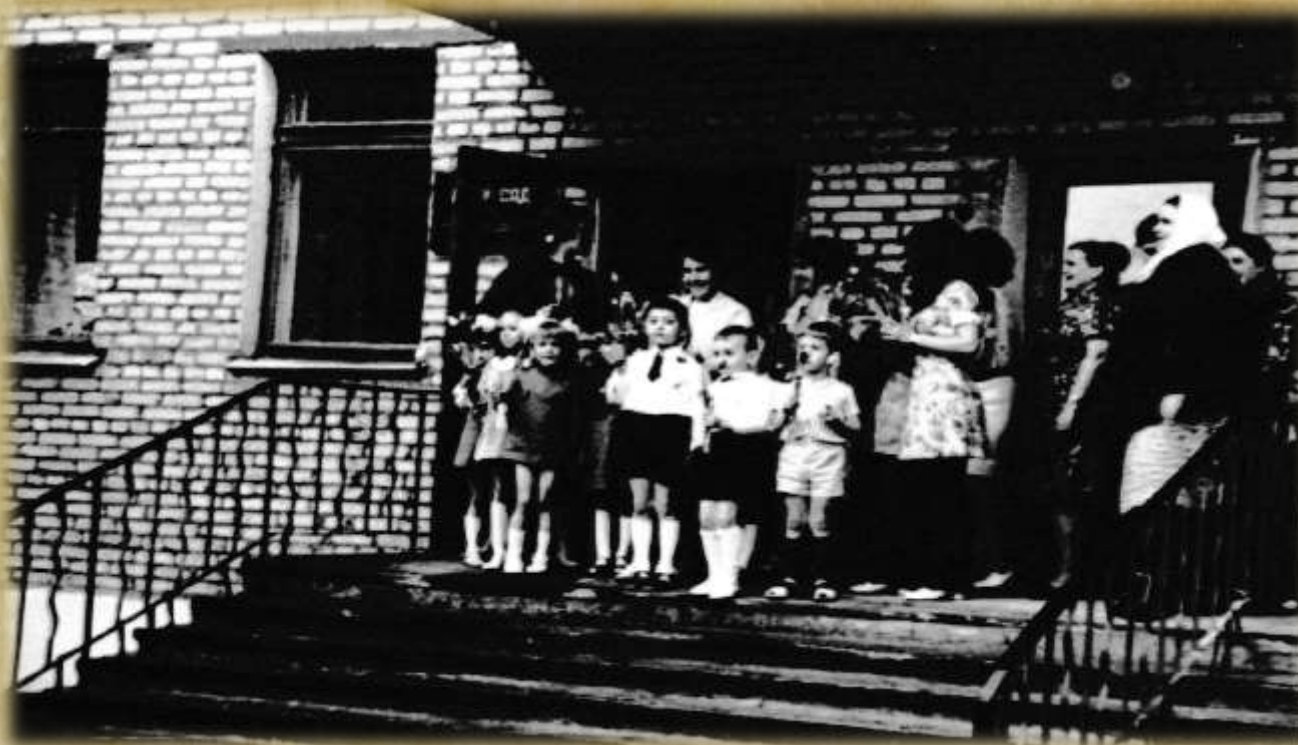
На фото: торжественное открытие ясли – сада № 31.

В здании нового детского сада функционировали 12 групповых помещений с отдельными спальнями, спортивный зал, медицинский блок, пищевой блок, прачечная и кабинет заведующей.