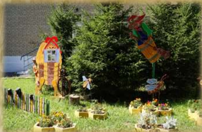
На фото: «Уголок сказки»

Детский сад продолжает преобразоваться: на территории созданы объекты, обеспечивающие разнообразную совместную деятельность детей и взрослых по оздоровительному, физическому, познавательному, эстетическому, игровому направлениям; коллектив благоустраивает и озеленяет прогулочные участки, экологические тропы, ухаживает за цветниками и клумбами, создаются комфортные условия для прогулок детей в любое время года и любую погоду.