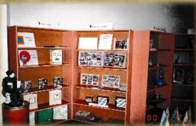
На фото: мини-музей (2004г.)

В целях повышения статуса образовательного учреждения, пустующие группы превратили в помещения дополнительного образования: театральная студия, изостудия, мини-музей.