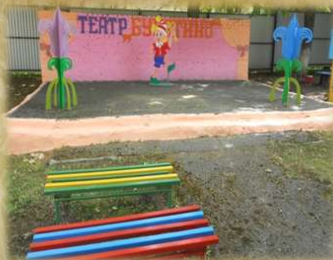
На фото: театральная площадка