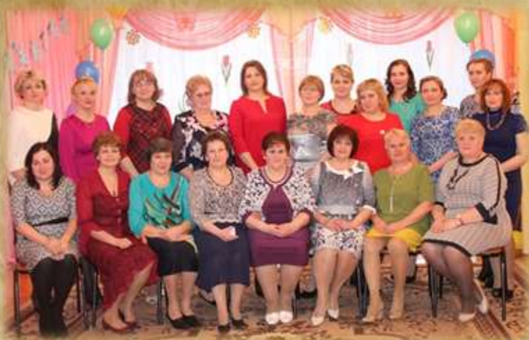
На фото: педагогический коллектив (2017г.)

За эти 46 лет неоднократно менялся коллектив дошкольного учреждения, но неизменным оставалось трепетное, бережное отношение к каждому ребёнку: энтузиазм, добросовестность, инициатива и искренняя заинтересованность сотрудников. Многие педагоги большую часть жизни посвятили дошкольному детству. Многие из них являются наставниками для молодых, передают свой богатый и бесценный опыт.