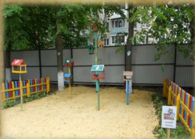
На фото: «Птичья столовая»