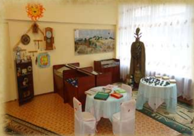
На фото: мини-музей «Наши коллекции» (2013г.)