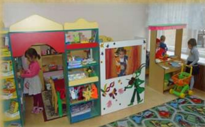
На фото: групповые помещения (2014-2015 г.г.)