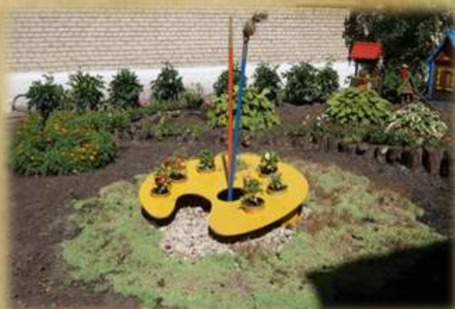
На фото: «Цветочная акварель»