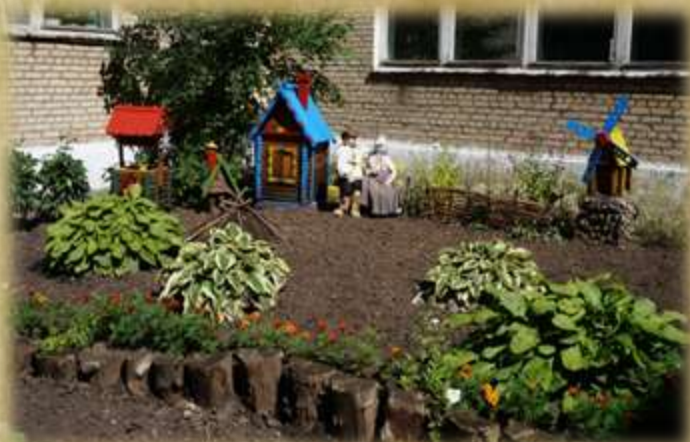
На фото: «Деревенский дворик»