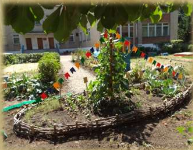
На фото: огород (2013г.)