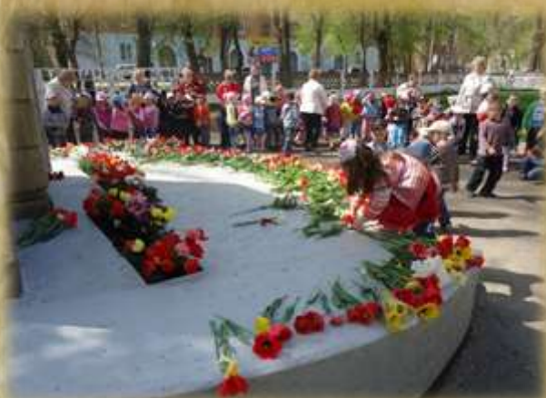
На фото: День Победы