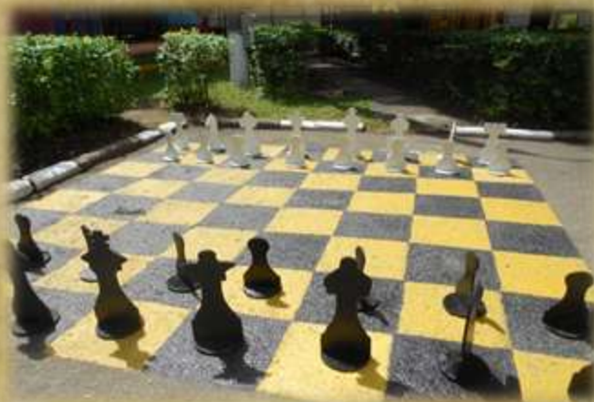
На фото: «Шахматы на асфальте»