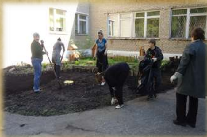
На фото: субботники