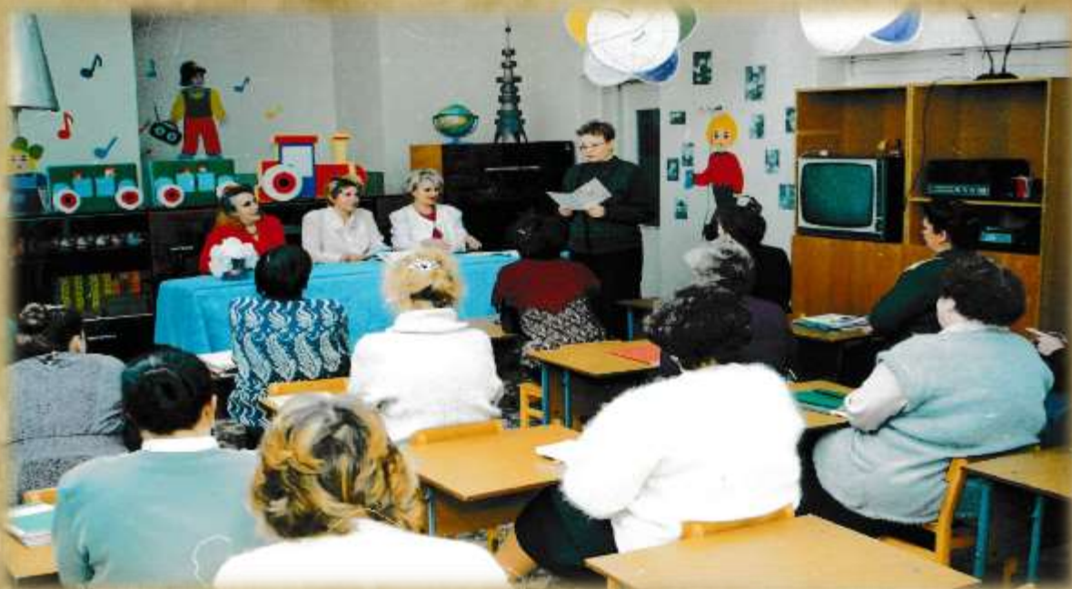
На фото: заседание педагогического совета (1995г.)