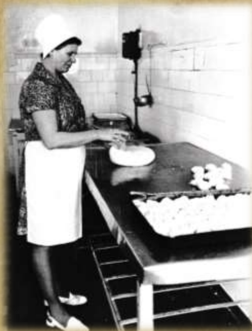
На фото: работник пищеблока.